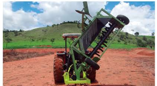
RENOVA TP 2.0 CONVENCIONAL

Equipamento acoplado no terceiro ponto do trator; com 02 pneus posicionados na parte traseira da estrutura para regulagem através de fuso (rosca) para se determinar a altura das aletas com o solo. Tractionado por trator acima de 50cv lastreado (potência variável de acordo com as condições do pátio) com disponibilidade de 01 comando hidráulico (cilindro) e TDP de 540 (tomada de potenciado trator). Trabalho em leiras com dimensões aproximadas de 2,0 (largura) x 1,20 (altura), podendo ter variações de acordo com o material a ser compostado.