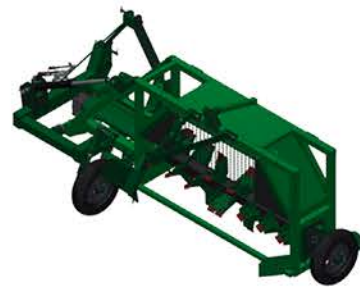
RENOVA 2.0 POWER

*Kit opcionais: Kit Tanque, Kit Sulcador e Kit Umidificador