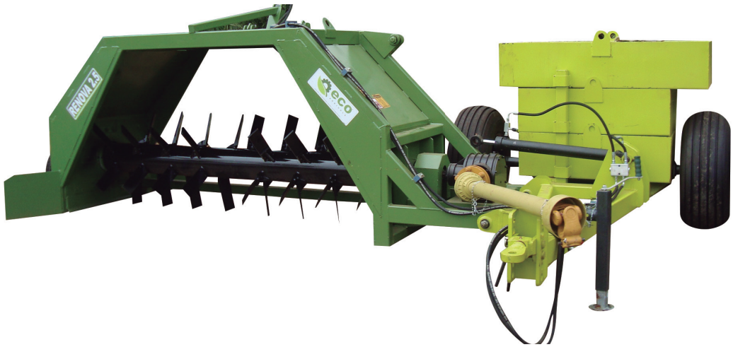
Kit Opcional: Sulcador